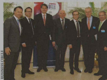
International besetzte Diskussionsrunde

Das Unternehmer-Forum dient einmal jährlich als exklusiver Treffpunkt für Unternehmer, Eigentümer, Firmengründer und Führungskräfte.