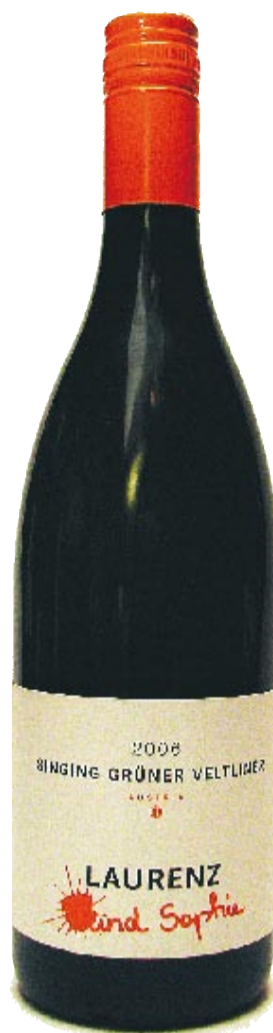
GRÜNER VELTLINER fra Niederoesterreich.