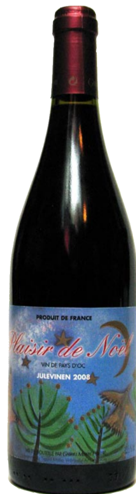
ETIKETTEN ER illustreret med tegninger fra bogen.